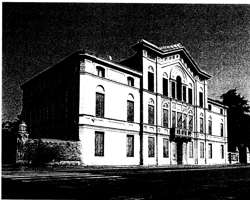
Villa Breda.

Nel settore degli acquedotti, una menzione particolare merita la costruzione tra il 1886 e il 1888 di quello patavino. In